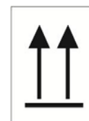
Bei Flüssigkeiten sind zusätzlich Ausrichtungspfeile auf 2 gegenüberliegenden Seiten anzubringen