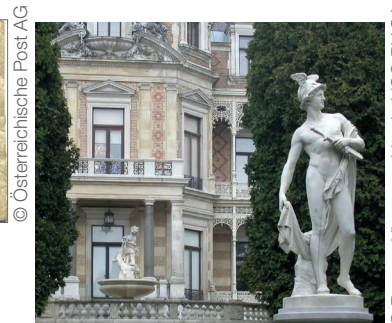
▲ Hermesstatue vor der Hermesvilla im Lainzer Tiergarten in Wien