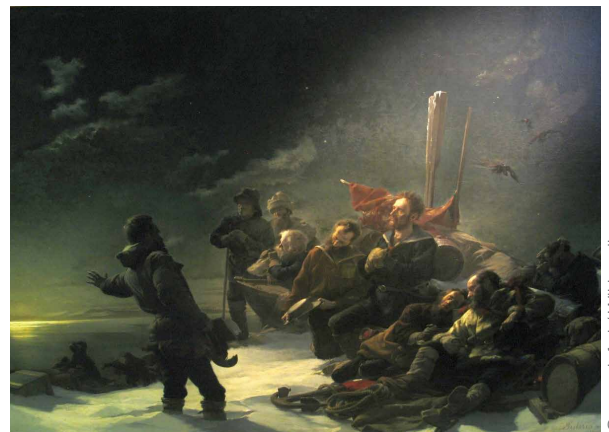
▲ Julius Payer, „Nie zurück!“, 1892

Im Sommer 1872 brachen sie mit dem Schraubendampfer Admiral Tegetthoff und 24 Mann Besatzung zu dieser Expedition auf, um neue Verkehrswege zu erschließen und das Polarmeer zu erkunden. Das Schiff wurde jedoch bald im Eis eingeschlossen und immer weiter abgetrieben. Dabei entdeckten die Männer eine Inselgruppe, die sie Franz-Joseph-Land nannten. 1874 gaben sie das eingeschlossene Schiff auf, bauten die Boote zu Schlitten um und marschierten zu Fuß über das Eis. Nach fast drei Monaten Strapaze erreichten sie das offene Meer und ruderten mit den rückgebauten Booten los, bis sie von Fischern aufgenommen wurden. Das von Julius Payer selbst gemalte Bildnis „Nie zurück!“ zeigt die dramatische Szene, als Weyprecht die erschöpften Männer nochmals zum Weitermarsch Richtung Süden bewegte und ihnen damit das Leben rettete.