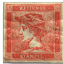
▲ Der berühmte zinnoberrote Merkur

Die berühmten von 1851 bis 1856 ausgegebenen „Merkure“ standen Pate für die innovative philatelistische Neuinterpretation des antiken Götterboten. Seiner Bedeutung entsprechend dienten die ersten Zeitungsmarken der Welt ausschließlich der Bezahlung des Zeitungsversands. 2022 wird mit diesem Briefmarkenblock ebenfalls ein Meilenstein gesetzt. Entworfen wurde der Block vom Cryptokünstler ARI PRATAMA und dem Verlag ENCODE Graphics. 2021 vom österreichischen Crypto Art Künstler PR1MAL CYPHER gegründet, verbindet er als erster Buch- und Kunstverlag die digitale Welt der NFTs (Non Fungible Token) und der Cryptoszene mit physischen Comics. Die auch wegen ihrer digitalen Einzigartigkeit begehrten Ergebnisse dieser Verbindung nennt man „Phygitals“. Mit der neuen Crypto stamp Art werden in naher Zukunft weltberühmte Cryptokünstler in die Welt der Philatelie integriert. Für Sammler*innen ergeben sich daraus attraktive Möglichkeiten, in beiden Welten ihre Schätze zu finden und zu hegen.